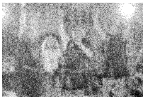
Piazza Maggiore, affollatissima. A destra la sfida tra arcieri : in basso i vincitori