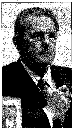
Jacques Rogge, presidente del Cio