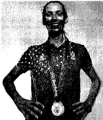
Dall'inviato Mario Arceri

PECHINO - L'eterno conflitto tra i calciatori e gli altri atleti, nel quale si mescolano un pizzico di invidia, una manciata di pretesa superiorità culturale e quanto basta di nobiltà sportiva (escludendo però le logiche di "mercato"), esplose lasciando Pechino, quando un gruppo di medagliati, all'imbarco sul volo per Roma dell'Air China, scopre che i campioni del pallone, reduci dalla figuraccia dell'eliminazione ai quarti di finale contro il Belgio, viaggerà nell'agio della business class, mentre loro, saliti sul podio olimpico, sono condannati alle sofferenze della classe economica.