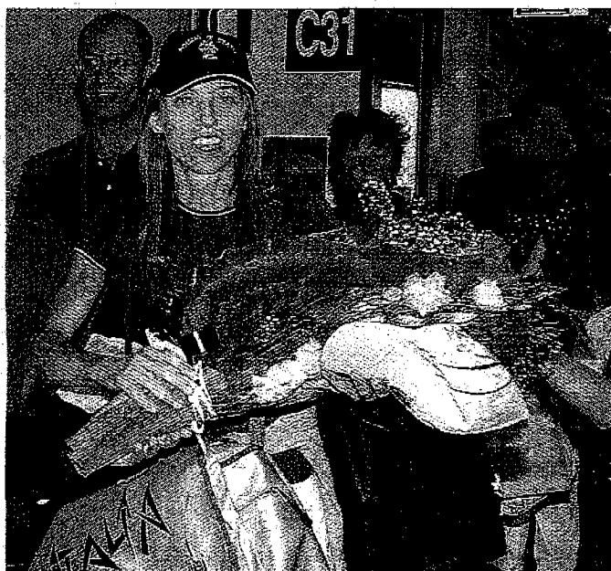
Valentina Vezzali, 34 anni, domenica al suo arrivo a Fiumicino