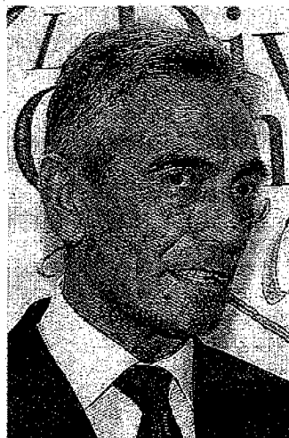
Gabriele Gravina, 54 anni

Rispetto per i club Gravina segue la linea del presidente federale Giancarlo Abete: evita-