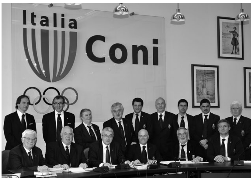
Il Consiglio Federale 2013-2016.