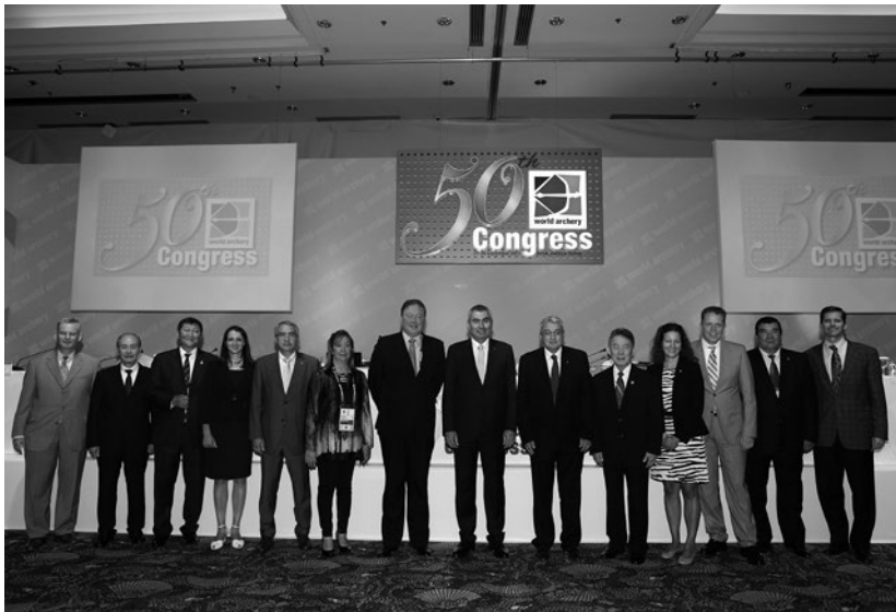
Il Consiglio World Archery al 50° Congresso di Belek-Antalya.