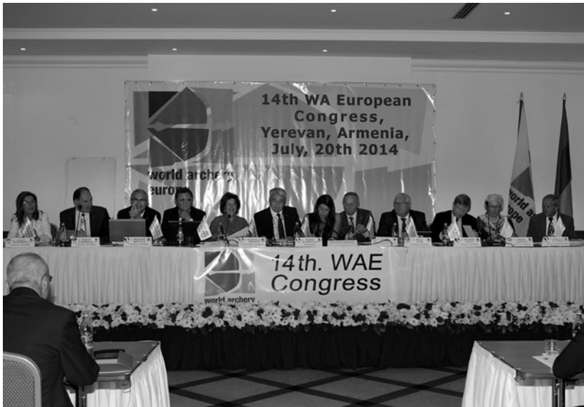
Il Consiglio World Archery Europe al 14° Congresso di Yerevan, in Armenia.