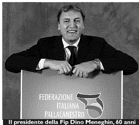
Il presidente della Fip Dino Meneghin, 60 anni

La pallacanestro è divertimento e integrazione. Viviamo in una società multirazziale, ma per abbattere ogni tipo di barriera ideologica o religiosa, dobbiamo piazzare un canestro ovunque, dagli oratori fino alle strade e le piccole piazze di quartiere