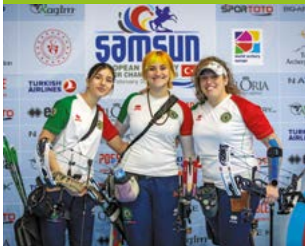
Sopra, le azzurre del compound autrici di una prova maiuscola sia a squadre che individuale; sotto, le azzurre dell'olimpico festeggiano il titolo continentale