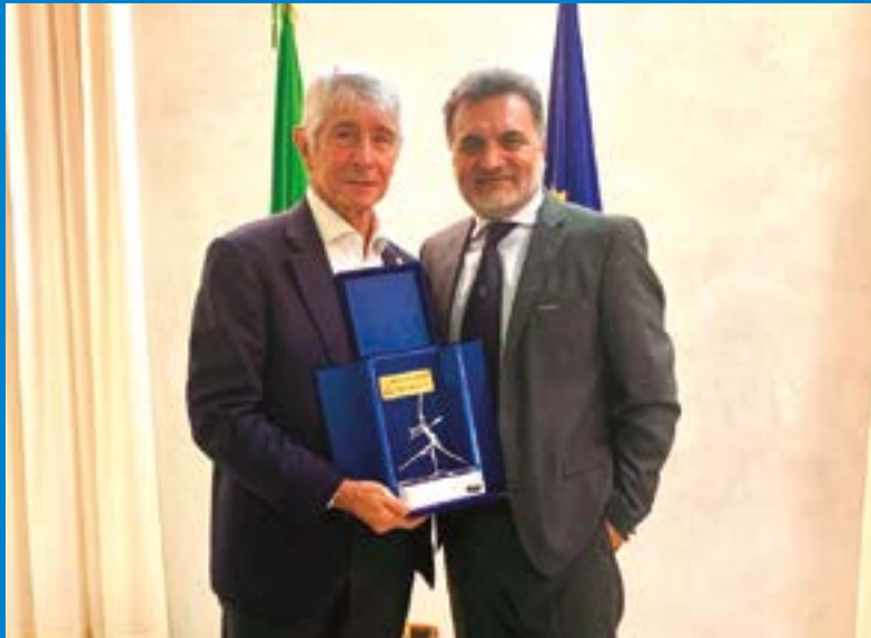
Il Presidente Polidori con il Ministro per lo sport Abodi

oltre a svolgere un importante lavoro sul territorio, tanto sul versante sociale quanto su quello agonistico, ha dato lustro all'Italia con le prestazioni degli arcieri azzurri nei massimi eventi internazionali".