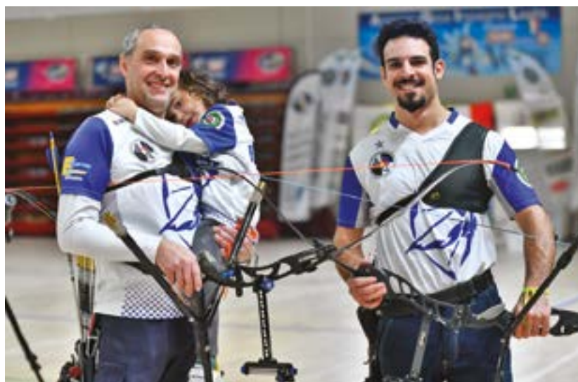
Airoldi e Garavaglia degli Arcieri Cameri festeggiano il titolo a squadre; sopra, la finale per l'oro ricurvo femminile