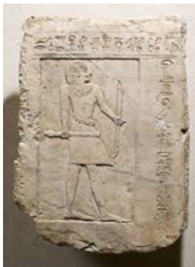
Stele funeraria di un arciere