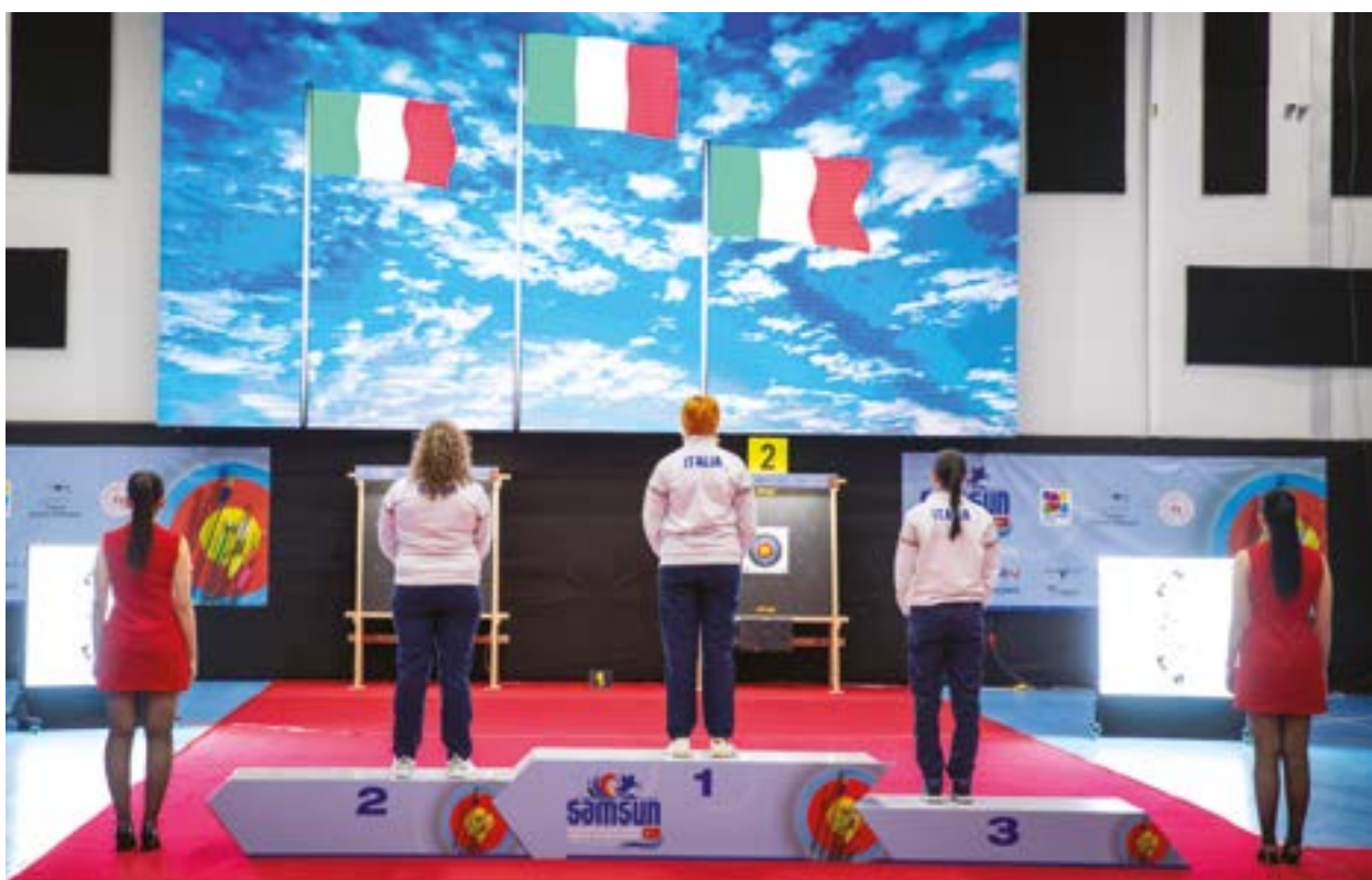
Le azzurre del compound compongono un podio tutto italiano