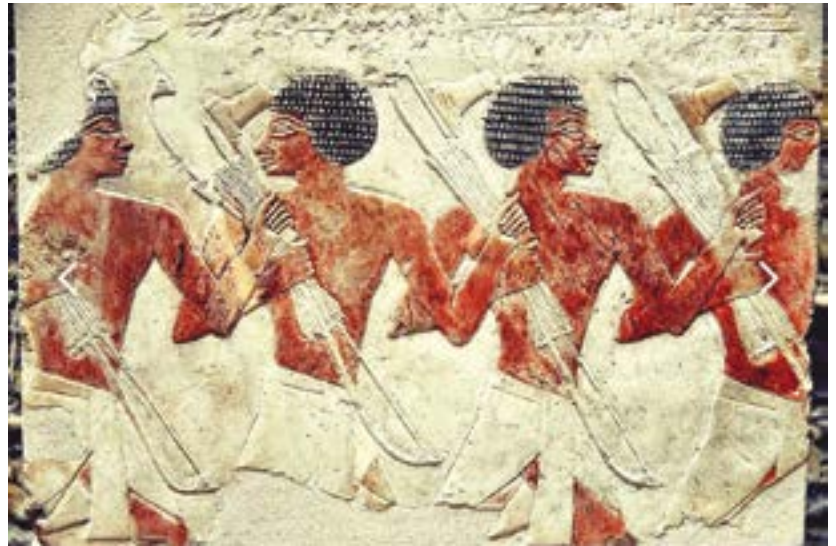
Immagini di arcieri in una tomba egizia

sono stati realizzati ciascuno con un pezzo di legno unico, di sezione circolare e di misura 152-162 cm, uno dei quali addirittura più alto del suo proprietario, che misurava appena 157 cm. Al loro ritrovamento, avevano ancora la corda di budello attorcigliata e legata a entrambe le punte. Le doghe misuravano 105-111 cm ed erano leggermente curvate nella parte superiore. Sebbene gli archi fossero utilizzati anche per la caccia ai margini del deserto e fossero considerati un segno di status sociale elevato, data l'instabilità politica di quel periodo e la frequenza degli scontri armati, sembra probabile che Iqer possa essere stato, a un certo punto della sua vita, un soldato della classe media sotto uno dei capi o re tebani.