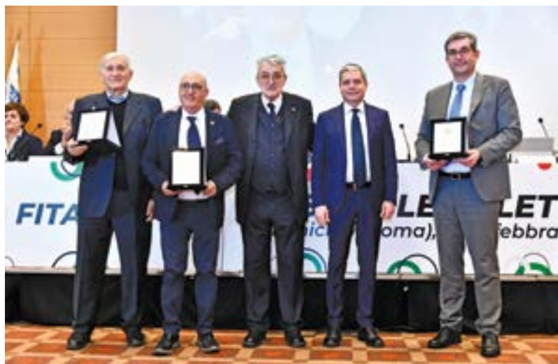
In queste pagine, la premiazione dei rappresentanti delle Società che hanno ottenuto le stelle al merito FITARCO e i premi assoluti per il maggior numero di tesserati e di atleti ai campionati italiani