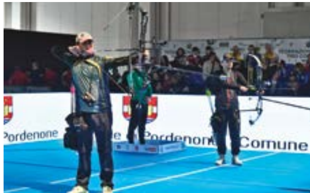
A sinistra, la finale arco nudo maschile; a destra, la finale del compound maschile; nella pagina a fronte, la finale a squadre dell'olimpico femminile

litare) piazza tutte le sue frecce sul "10" e vince 7-1.