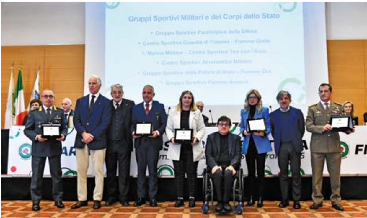
il premio ai rappresentanti dei Gruppi Militari e dei Corpi dello Stato

Un esempio da seguire, soprattutto per le nuove generazioni. Le sue qualità umane si abbinano all'eccellenza agonistica. La voglia di migliorarsi, di sfidare i propri limiti e la capacità di impegnarsi senza riserve sono l'unica via che conosce per sentirsi realizzata. Con questi presupposti ha cominciato a tirare con l'arco da bambina fino a firmare pagine indelebili nella storia dello sport italiano, trovando anche il tempo, tra un europeo e un mondiale, di laurearsi e diventare un chirurgo. Ha abbattuto ogni barriera vestendo la maglia della Nazionale Olimpica e Paralimpica conquistando, oltre a podi internazionali e record, anche i tricolori assoluti. Parlano per lei i risultati ottenuti alle Paralimpiadi: argento individuale a Londra 2012, bronzo mixed team a Rio 2016 con Roberto Airoidi, argento mixed team a Tokyo 2020 con Stefano Trivisani e, infine, bronzo individuale e oro mixed team ancora con Trivisani a Parigi 2024. Il suo pianto liberatorio dopo l'ultima freccia all'Esplanade des Invalides ha emozionato tutti gli italiani.