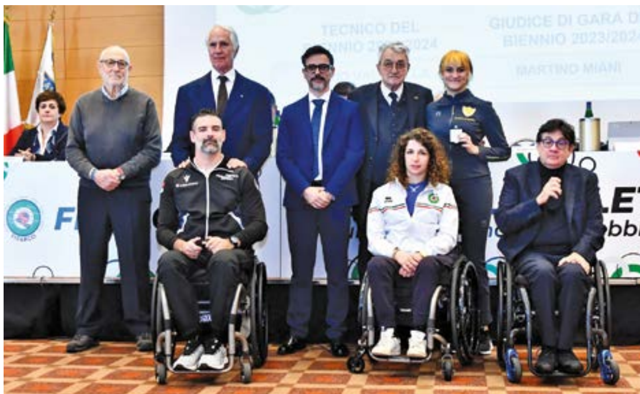
La consegna del premio ai migliori atleti, al miglior tecnico e miglior arbitro del biennio 2023-2024

Successivamente, sono stati chiamati davanti alla platea gli atleti nominati dal Consiglio Federale i migliori del biennio 2023/2024. Come detto, tra le donne il premio è andato alla campionessa paralimpica Elisabetta Mijno , con la seguente motivazione: