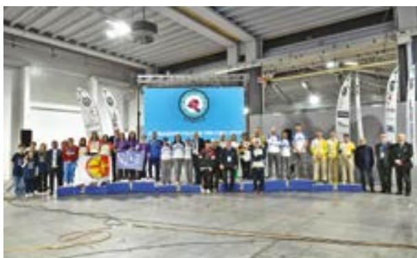
A sinistra, il podio a squadre arco nudo; a destra, i podi assoluti a squadre compound