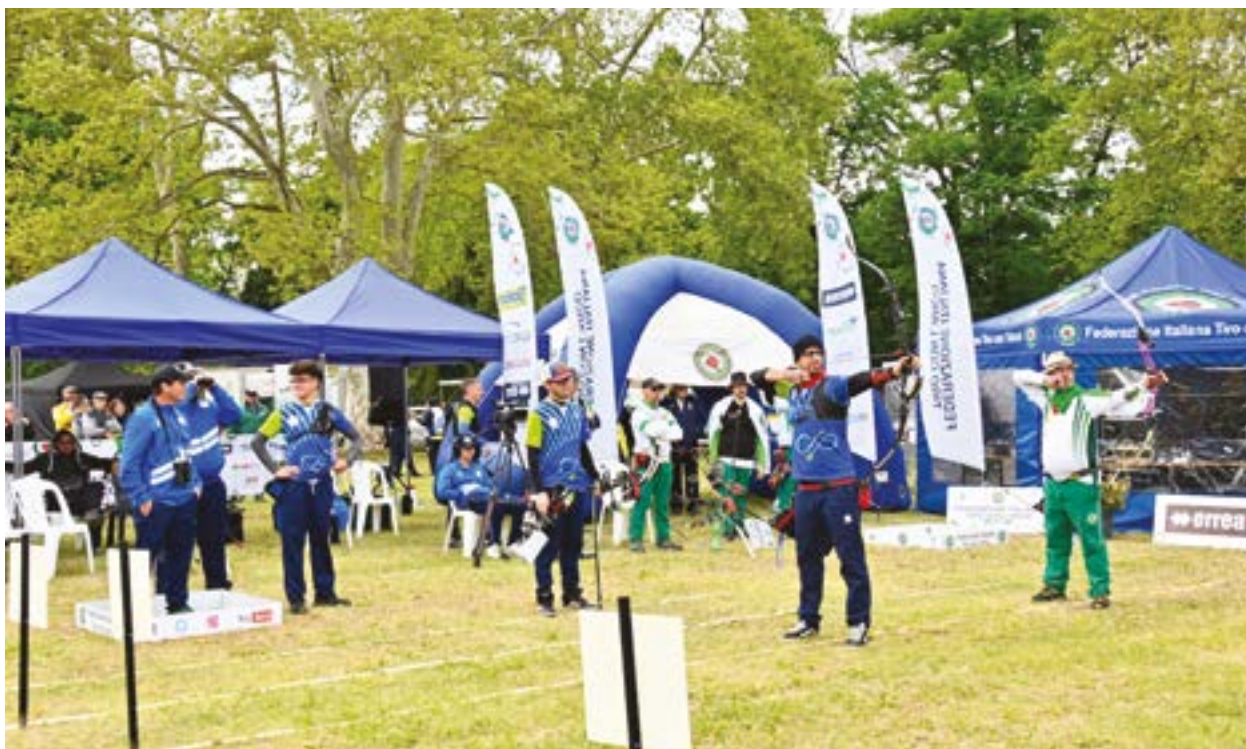
Le squadre finaliste dei Campionati di Società 2024

Le posizioni all'interno di ciascun girone verranno assegnate in base al numero di punti ottenuti da ciascuna squadra negli scontri diretti (2 punti per la squadra vincente, 0 punti per la squadra perdente, 1 punto a testa in caso di pareggio). In caso di parità fra due o più