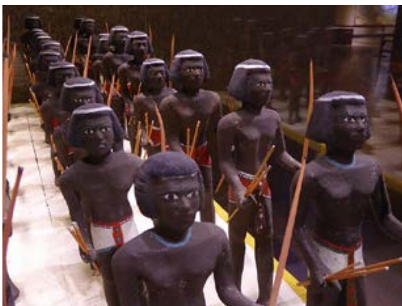
Arcieri nubiani; in alto, Papiro di Ani - Horus (libro dei morti)

era altro che la continuazione dell'esistenza di questo mondo: dopo il trapasso, l'anima restava nella Duat in attesa del giudizio delle divinità e il suo destino dipendeva dalla sua giustizia morale e dalla prontezza dimostrata nel compiere il suo percorso evolutivo e spirituale, che proseguiva per l'ultima parte nell'aldilà. Compiuto il viaggio cosmico e superate le prove, l'anima veniva condotta al cospetto di Osiride dal dio falco Horus, armato di arco e frecce, e poteva raggiungere la stabilità e lo stato di ahu , lo spirito effettivo di nucleo solarizzato, mantenendo la propria individualità e ritornando così alle stelle, da dove venivano gli uomini e gli dèi. Le tombe erano particolarmente importanti per gli egizi, poiché il defunto iniziava proprio da lì il suo viaggio nell'aldilà: ne rispecchiavano la personalità e il rango e gli fornivano tutto l'occorrente per la sopravvivenza, nell'attesa della sua psicostasia (la pesatura del cuore, con cui si giudicavano le sue azioni). Nel caso di personaggi di alto rango, le tom-